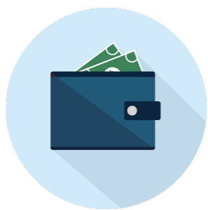
cash on delivery